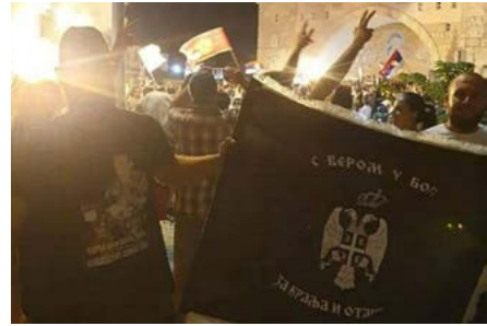
Noćni vukovi u Cetinjskom manastiru (lijevo)