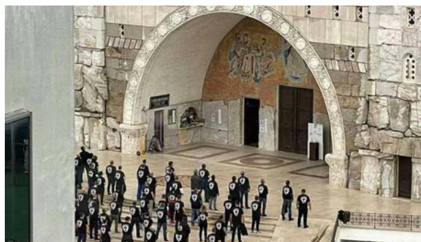
Pravoslavno bratstvo Stupovi ispred Hrama u Podgorici u formaciji (desno)

Protesti protiv Zakona o slobodi vjeroispovijesti – tkzv. litije iznjedrile su na površinu snažnu i dobro organizovanu strukturu prosrpskih i proruskih desnih pokreta, grupa i organizacija na antizapadnim i proruskim vrijednosnim osnovama, sa vidljivim elementima religijskog i nacionalnog konzervativizma. Iz litijskog pokreta iznikle su brojne grupe od kojih su se neke okrenule političkom djelovanju i iz kojih su potekli crnogorski premijer Krivokapić i dio ministara iz njegove vlade. Druge, poput pravoslavnih bratstava, svoju misiju opisuju kao patriotsku i humanitarnu, dok djeluju sa ikonografijom karakterističnom za desničarske grupacije.