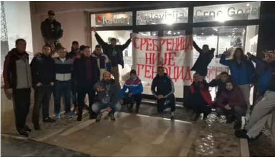
Negiranje genocida na protestu Stupova ispred RTCG (lijevo)