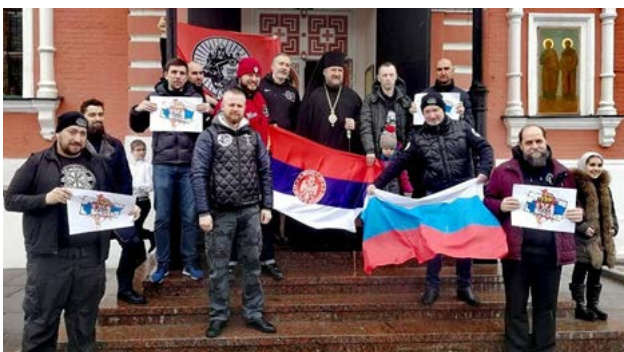
Sorok Sorokov protest podrške SPC (lijevo)