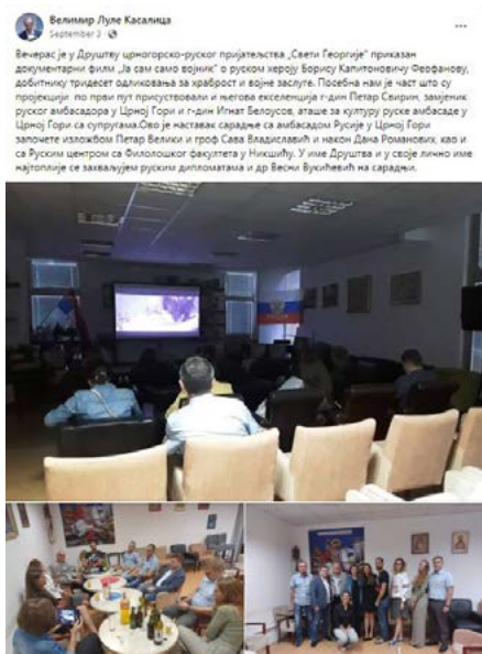
Sveti Georgije sa RF ambasadom i promocija knjige

Dominantno kao reakcija na agresivan-negatorski stav velikosprskog nacionalizma prema crnogorskom nacionalnom identitetu, a usljed slabljenja struktura građanskog društva, i na procrnogorskoj strani pored pojedinačnih istupa uočavamo i neke naznake desničarenja i neprimjerenih parola i pjesama, poput provokativnog pjevanja nacionalističkih pjesama pristalica hrvatske ekstremne desnice. u toku nekoliko pro-crnogorskih skupova u organizaciji Patriotsko-komitskog saveza.