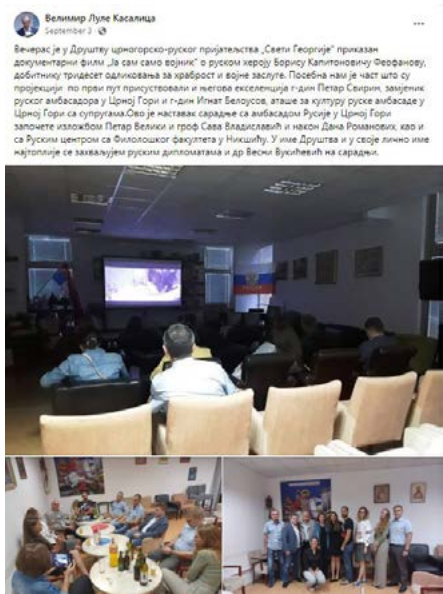
Sveti Georgije sa RF ambasadom i promocija knjige

Dominantno kao reakcija na agresivan-negatorski stav velikosprskog nacionalizma prema crnogorskom nacionalnom identitetu, a usljed slabljenja struktura građanskog društva, i na procrnogorskoj strani pored pojedinačnih istupa uočavamo i neke naznake desničarenja i neprimjerenih parola i pjesama, poput provokativnog pjevanja nacionalističkih pjesama pristalica hrvatske ekstremne desnice. u toku nekoliko pro-crnogorskih skupova u organizaciji Patriotsko-komitskog saveza.