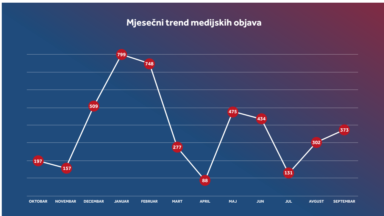
Grafik 2: Mjesečni trend medijskih objava

Trend objavljivanja po mjesecima ( Grafik 2 ) pokazuje da su srbijanski mediji bili najaktivniji u decembru, januaru i februaru što se poklapa sa periodom kada je Zakon o slobodi vjeroispovijesti usvojen i kada su se litije održavale.